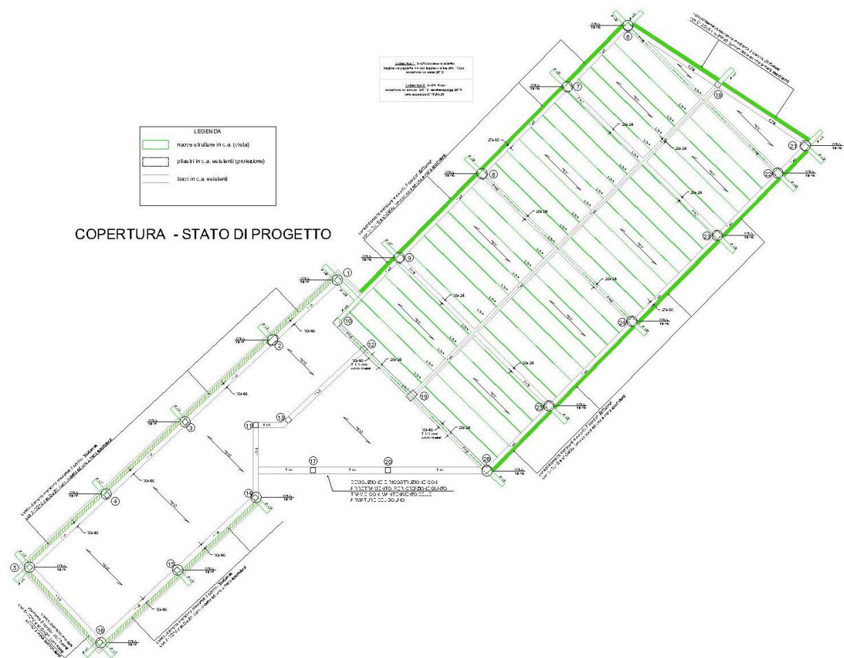
Figura 3 – Pianta copertura.

E' inoltre prevista la demolizione e ricostruzione di una porzione di solaio in corrispondenza del giunto sismico da creare in corrispondenza dell'ingresso agli spogliatoi dal plesso scolastico.