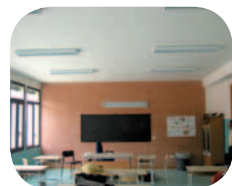
L'esterno e un'aula della scuola di Monzuno