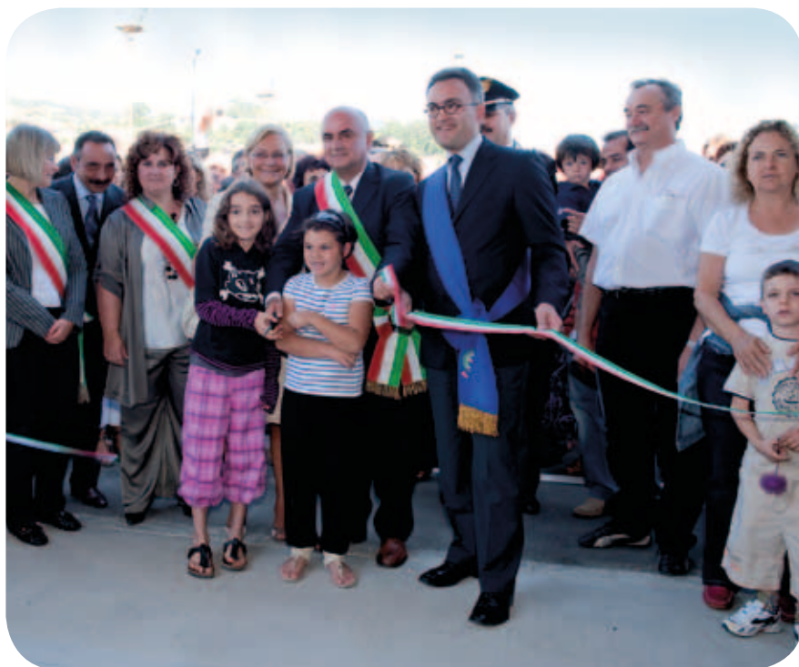
I ragazzi della scuola di Marzabotto tagliano il nastro insieme alle autorità di Comune, Provincia e Regione

Un momento importante per tutta la comunità che celebra così il primo edificio scolastico in tutta la regione costruito con un'innovativa tecnica di isolamento sismico, un complesso di 3.000 mq composto da 15 aule, 5 laboratori attrezzati, un'aula magna, una palestra e una cucina centralizzata. Un intervento, finanziato interamente da Autostrade per l'Italia per oltre 5 milioni di euro , "frutto del rapporto virtuoso tra istituzioni e imprese" come ha sottolineato il Vice Presidente Venturi e ha rimarcato la Vice Presidente Saliera. "È il frutto della scelta di dialogo avviata negli anni '90 con la proposta delle grandi opere. Allora si rifiutò il muro contro muro e ora ne vediamo gli effetti". Il Sindaco ha ricordato come l'apertura della scuola sia la "realizzazione di un sogno" alla quale hanno lavorato le amministrazioni comunali precedenti insieme a tutta la cittadinanza.