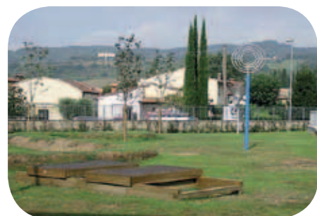
Nella foto in alto il Sindaco Zanieri durante l'inaugurazione, sotto le sculture nel parco della scuola di Galliano